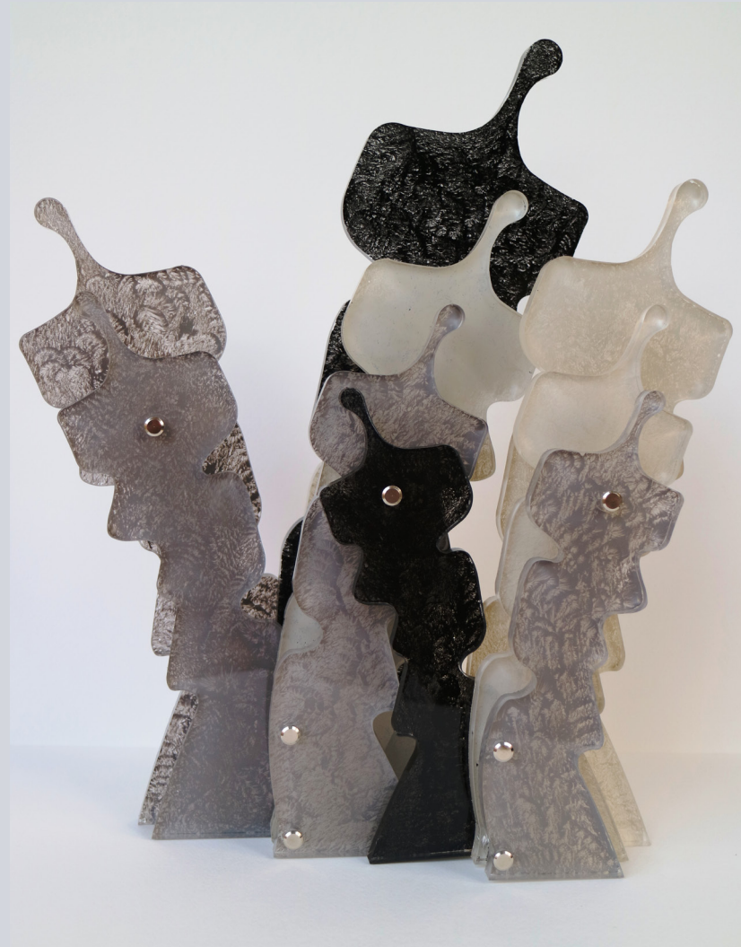
TERESA CONDITO, l'incontro - the meeting. plexiglass e acrilico, 39 x 33,5 x 12 cm