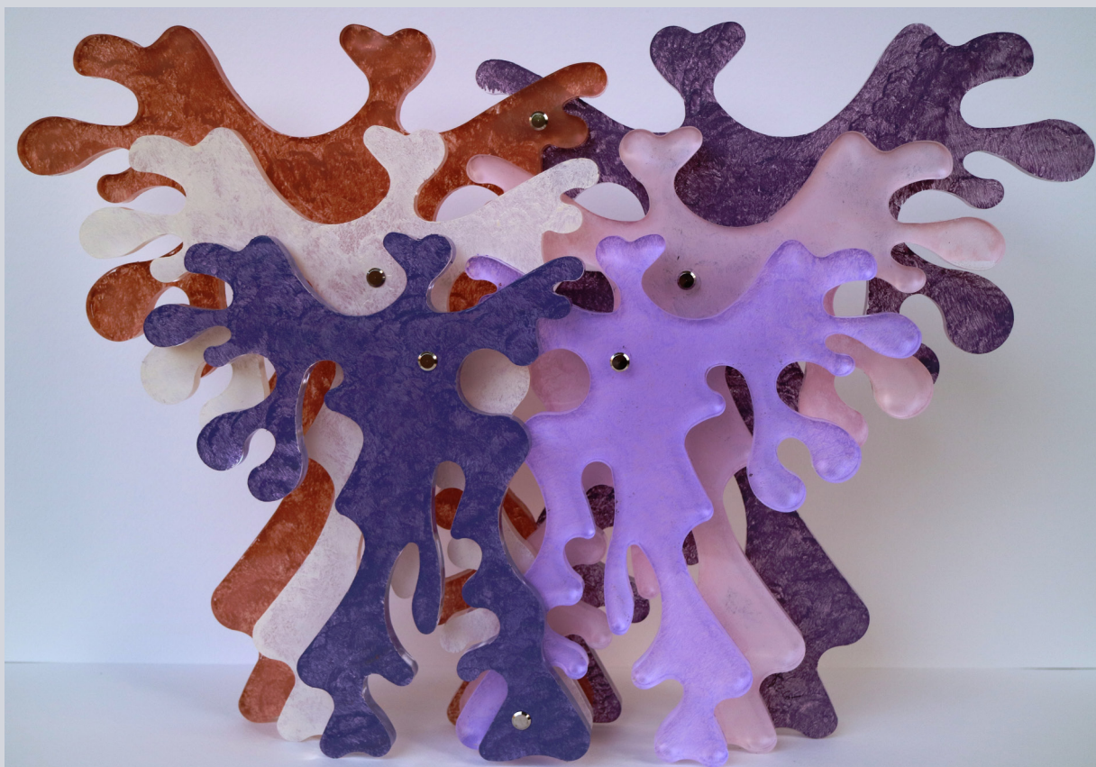
TERESA CONDITO, Angels, plexiglass e acrilico, 35 x 52 x 7 cm