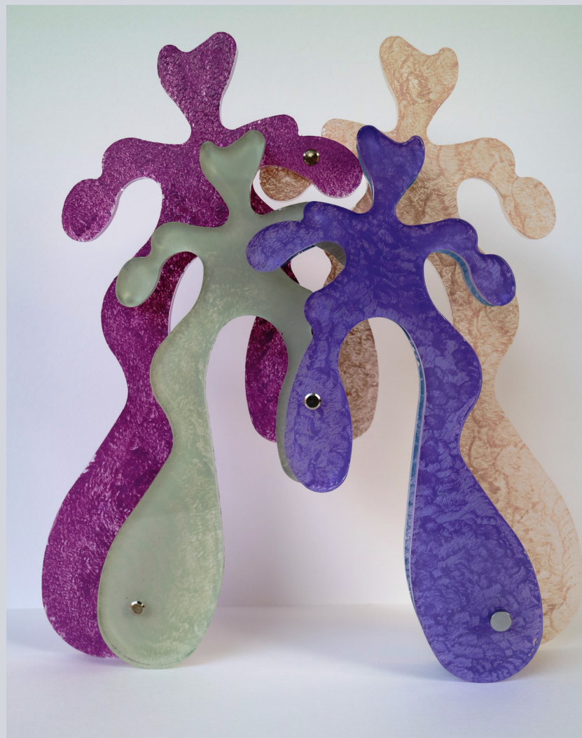
TERESA CONDITO, The Race, plexiglass e acrilico, 35 x 28 x 6 cm