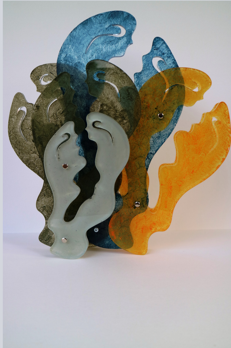
TERESA CONDITO, Love in the air puffs, plexiglass e acrilico, 41 x 39 x 8 cm