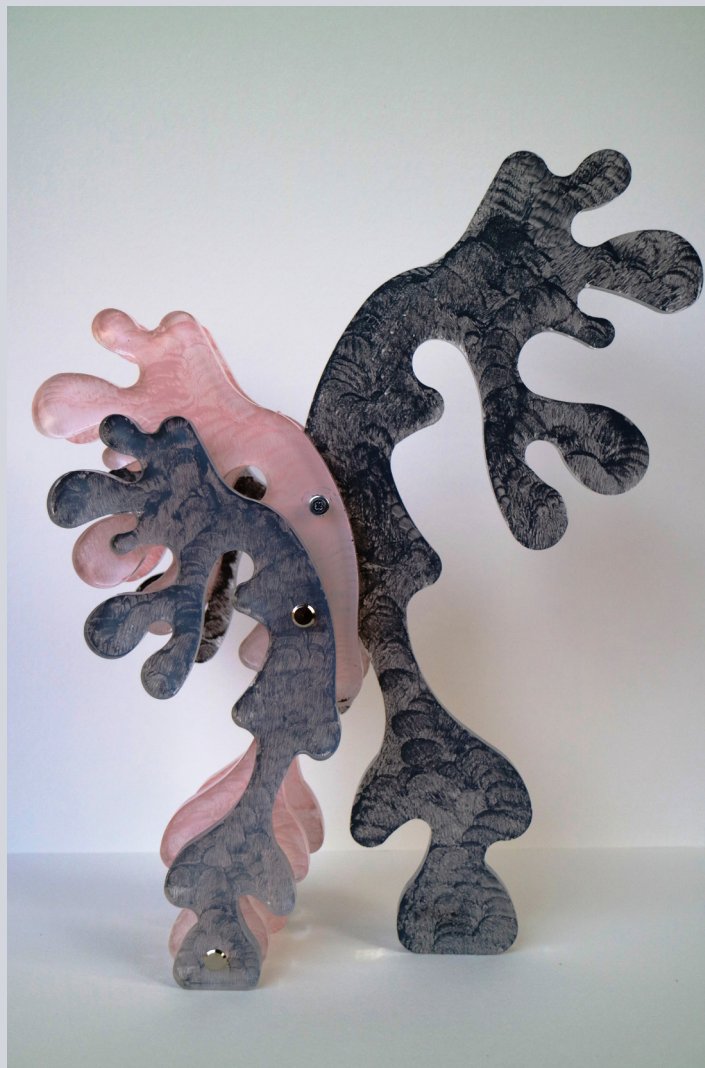
TERESA CONDITO, Il ballo - dancing, plexiglass e acrilico, 33 x 27 x 10 cm