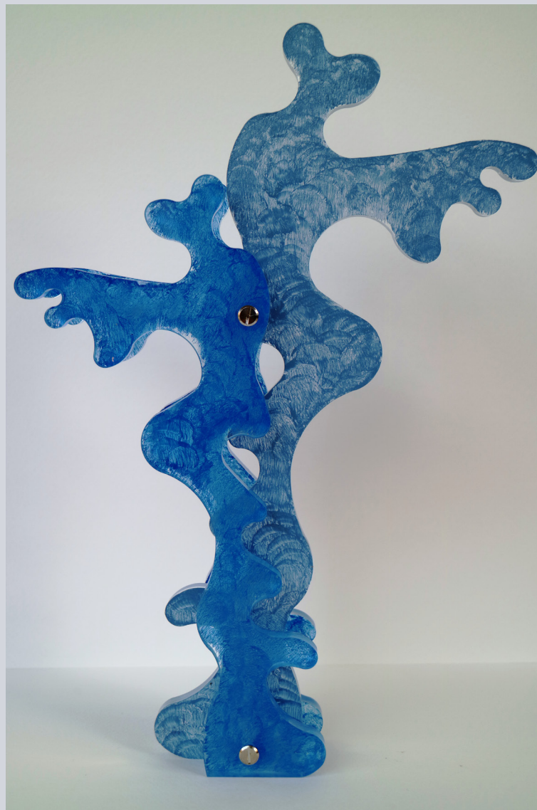
TERESA CONDITTO, Armony, plexiglass e acrilico, 65 x 33,5 x 32 cm