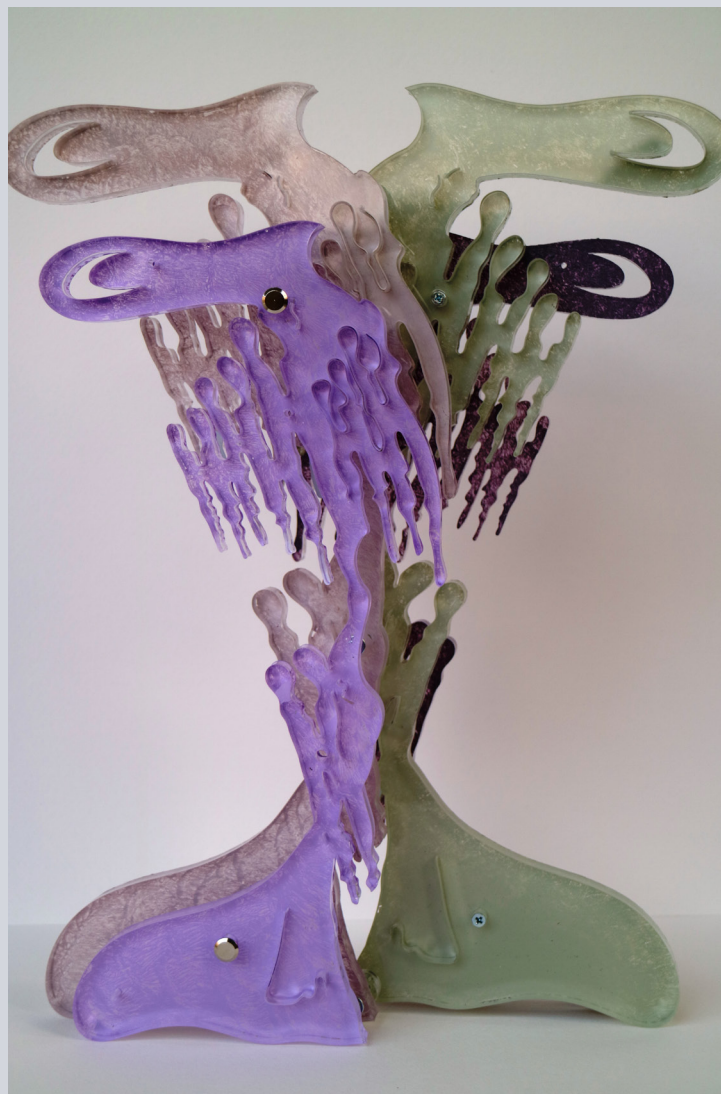
TERESA CONDITO, The tree of Life, plexiglass e acrilico, 35 x 26,5 x 7 cm