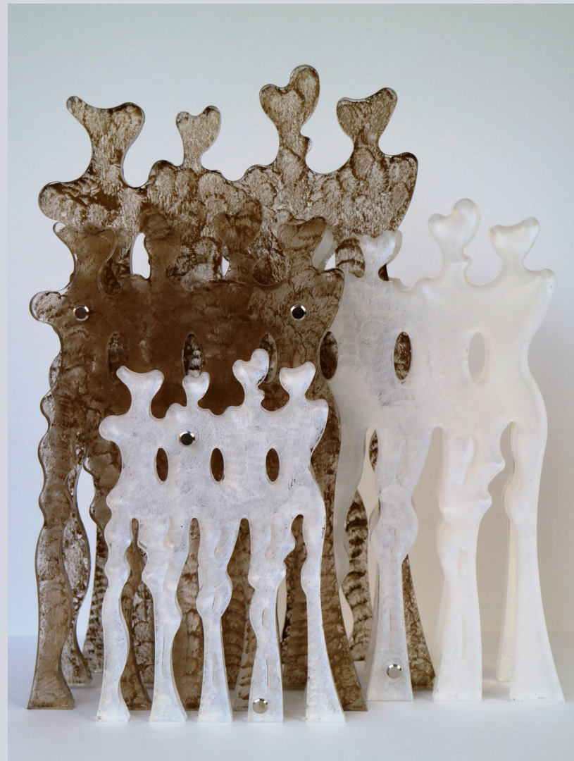
TERESA CONDITO, Bravery, plexiglass e acrilico, 35 x 30 x 13 cm