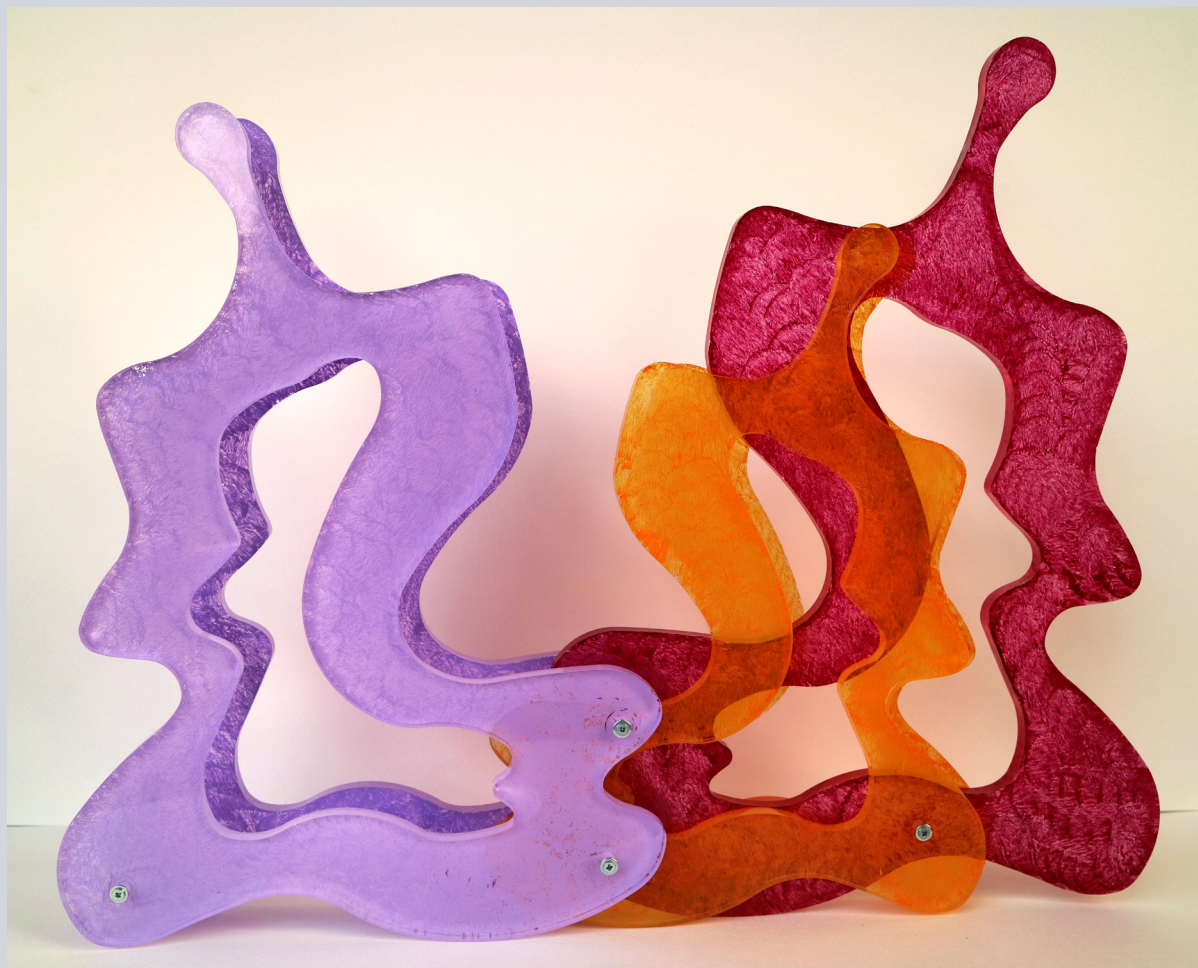
TERESA CONDITO, Three women, 40 x 51 x 5 cm