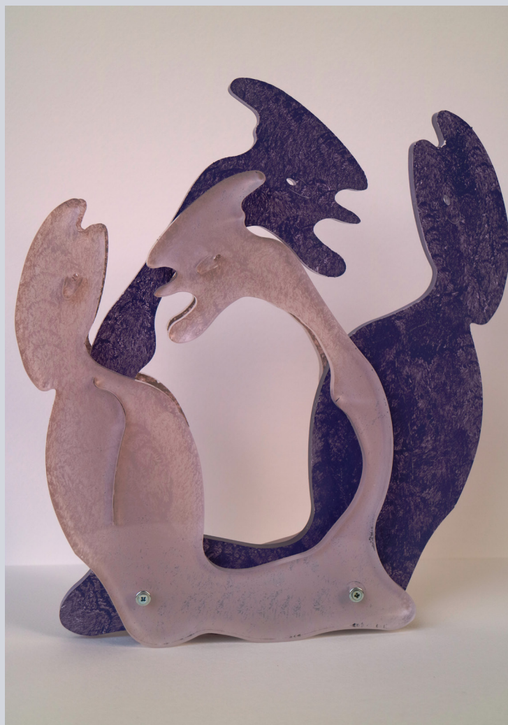
TERESA CONDITO, L'Oca e il Coccodrillo (the Duck and the Crocodile) plexiglass e acrilico, 30 x 27 x 5 cm